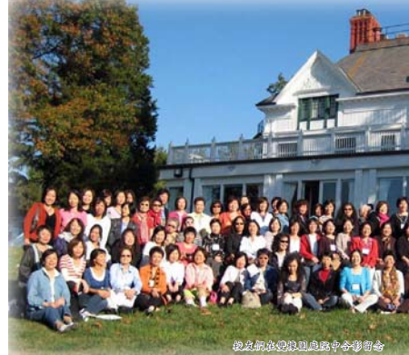
校友和家屬與地產經紀合影