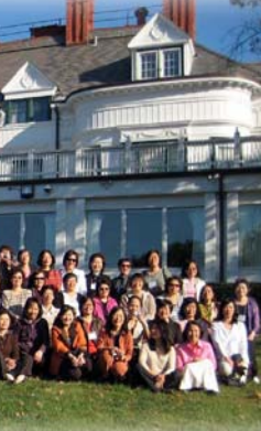
休士頓地區的校友表演夏威夷舞