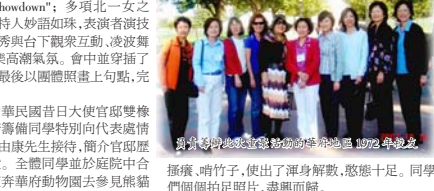
探探 嚕竹子，使出了渾身解數，憨態十足。同學們個個拍足照片，盡興而歸。

Houston 5, Motown Showdown"; 多項北一女之"最"等等。席間各主持人妙語如珠，表演者演技精湛。歐陽非菲模仿秀與台下觀眾互動，凌波舞競技，更帶動全場共樂高潮氣氛。會中並穿插了許多抽獎活動。晚會最後以團體照畫上句點，完美落幕。 最後一日首先前往中華民國普日大使官邸雙橡園參觀。此乃由華府籌備同學特別向代表處情商才得以進訪。當天由康先生接待，簡介官邸歷史、環境，及室內擺設。全體同學並於庭院中合影留念。接著全體直車華府動物園去參見熊貓寶貝「泰山」。據導遊說，泰山不受指彈，見到本尊的機會可遇不可求。有人多次求見都只能遠觀背影。 當天訪北一女之福，泰山全力配合，翻跟斗、直立、